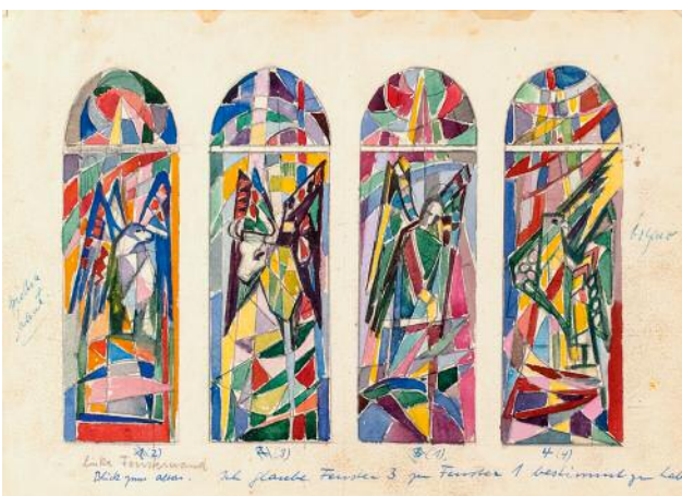
11_ Entwurf für die Fenster in der Deutschsprachigen Evangelischen Gemeinde in Barcelona: o.J. Aquarell auf Papier, 29,5 x 32,5 cm © Künstlernachlässe Mannheim