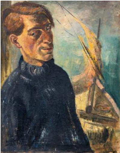
1_Selbstbildnis mit Segelboot, 1932. Öl auf Leinwand, 70 x 55 cm