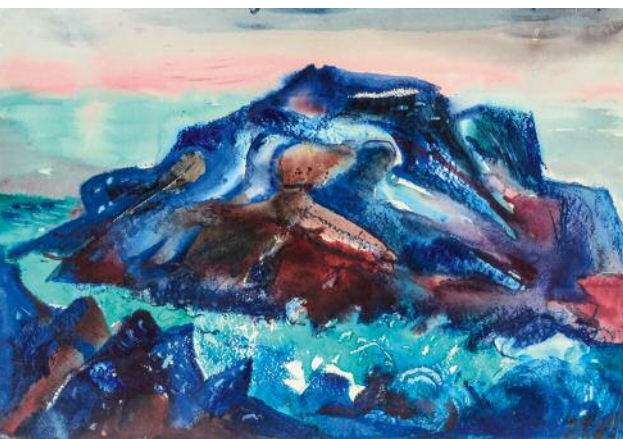
5_Großer blauer Fels, Island, 1966. Mischtechnik auf Papier, 50 x 72,5 cm © Künstlernachlässe Mannheim