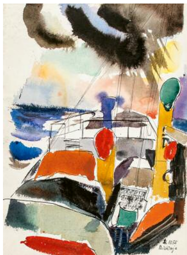
4_Biskaya, 4.11.1955. Aquarell auf Papier, 39 x 29 cm