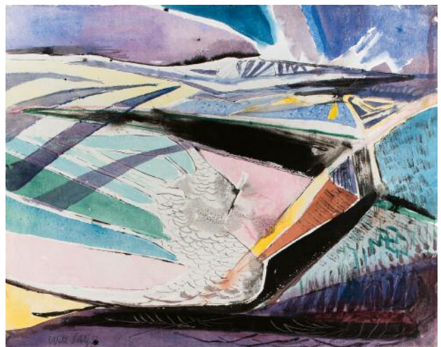
6_Wolkenschatten, 1952. Aquarell auf Papier, 50 x 65 cm