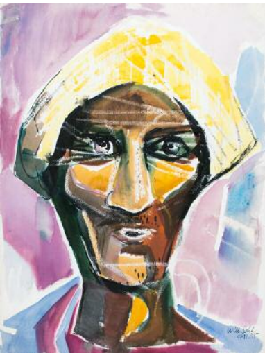
3_Kopf eines Arabers, 19.12.1955. Aquarell auf Papier, 64 x 49 cm