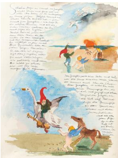
9_ Die Geschichte vom bösen Mann: o.T., 1937. Aquarell auf Papier, 31,5 x 25,5 cm