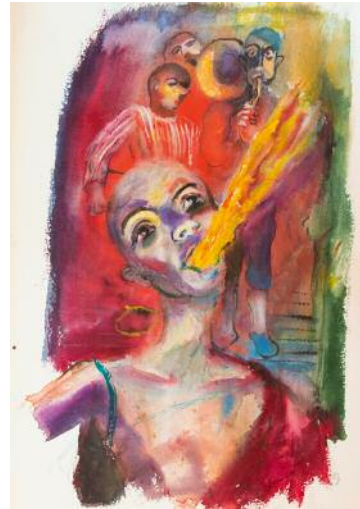
8_ Jahmarktserinnerungen, 1941: Feuerspuckende Artistin. Aquarell auf Papier, 45,3 x 31,8 cm © Künstlernachlässe Mannheim