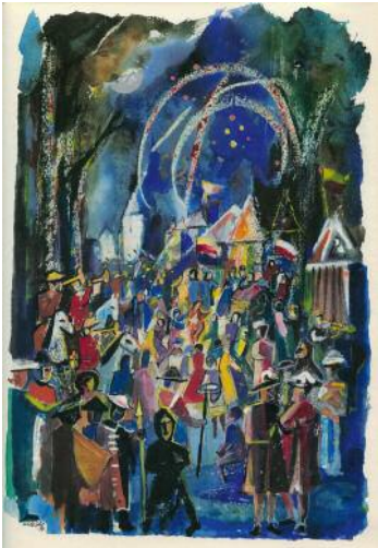
7_ Gartenkonzert im Schloss Gaibach, Illustration aus: Fürstbischöfliche Badereise 1722, S. 67 © Künstlernachlässe Mannheim