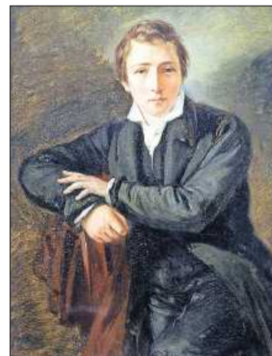
Heine nach einem Gemälde von Moritz Daniel Oppenheim.